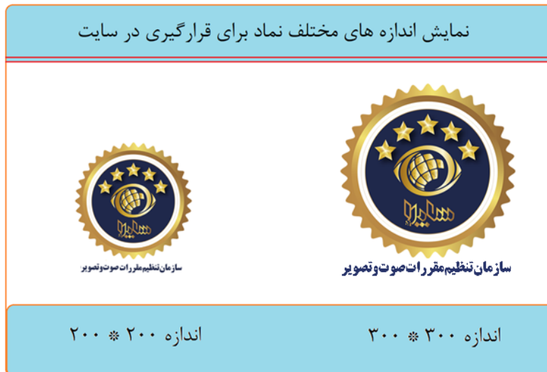
شکل ۴. نمایش دو اندازه مختلف نماد

نماد ساپرا با دو اندازه ۳۰۰*۳۰۰ و ۲۰۰*۲۰۰ قابل دسترسی است که شکل آن به صورت زیر است: